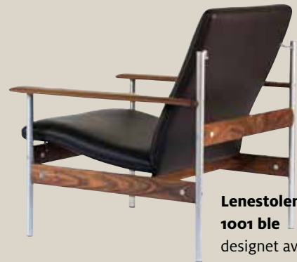
Lenestolen 1001 ble designet av Sven Ivar Dysthe i 1960, og relansert i 2017. Originalen var i palisander, mens dagens versjon er i valnøtt, fjordfiesta.com.