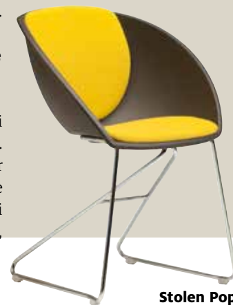
Stolen Popcorn ble designet av Sven Ivar Dysthe til Henie Onstad Kunstsenter i 1968. Den ble relansert av ForaForm i 2012.