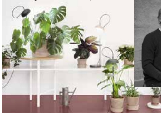
HØY TRIVSEL. Lampen Ki fra Elementa bidrar til gode vekstforhold for plantene.