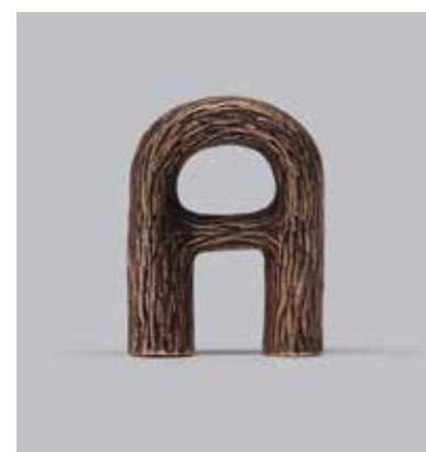
BOKK AV SIGVE KNUTSON FOR NEDRE FOSS

KRITERIUM Prisen gis til et produkt som løfter og tilfører interiøret «det lille ekstra» – og som i seg selv har det lille ekstra hva gjelder kvalitet og uttrykk.