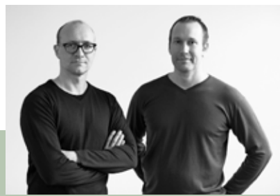
SOFASYSTEM. Senso er designet av Anderssen & Voll for Fora Form.

Sigve beveger seg fritt mellom design, kunst og kunsthåndverk, og skaper objekter, verker og produkter det er vanskelig å definere. Men at de taler til oss, er det ingen tvil om. Sigve er et friskt pust på den norske designscenen, og hans nytenkning er inspirerende for alle som kommer i kontakt med verkene hans. Han har stilt ut både i inn- og utland, i tillegg til å ha fått sitt første masseproduserte objekt i salg. Bokk fra Nedre Foss.