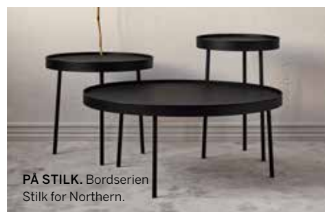
PÅ STILK. Bordserien Stilk for Northern.