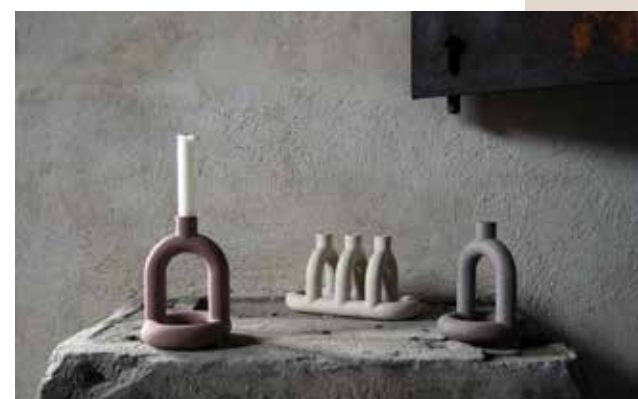
KAPP AV NOIDOI

Flaskeåpneren Bokk er unik: Ved første øyekast oppfatter man den som et dekorobjekt, mens funksjonen – at den faktisk åpner flasker – er skjult. På den måten får en tilsynelatende «kjedelig» bruksting ny verdi. Både materialet – bronse – og utformingen er overraskende, helt i tråd med designer Sigve Knutsons arbeider.