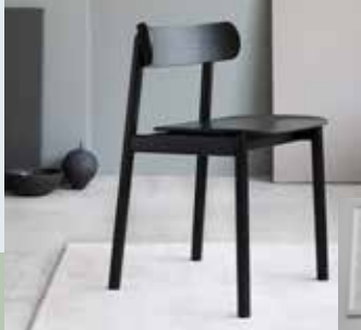
NYTT TILSKUDD. Tonje bidrar til AE, Os stadig voksende kolleksjon for Tonning & Stryn.