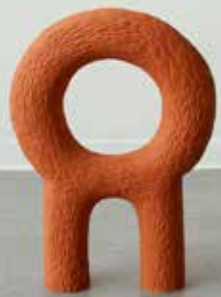
BLIKKFANG. Sigve lager kunst såvel som design.