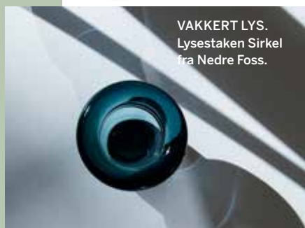
VAKKERT LYS. Lysestaken Sirkel fra Nedre Foss.