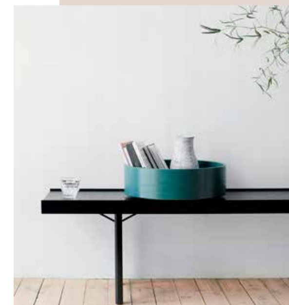
TILBEHØRSERIE AV JENKINS & UHNGER FOR FJORDFIESTA

Lysslukkeren Apex er ett av tre bidrag til Candle Snuffer Collection fra den bærekraftige produsenten Othr. Vera & Kytes tilskudd til stålkolleksjonen er en studie i geometriske former og utforsker flater og volumer. Det beste – foruten den harmoniske designen – er imidlertid at den 3D-produseres på etterspørsel, noe som minsker unødig ressursbruk. Bra for miljøet, bra for oss!